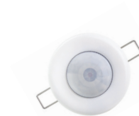
Встраиваемый потолочный датчик движения