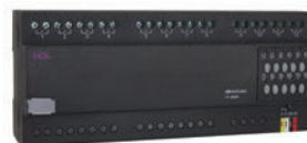
12 канальное 10А/канал Реле