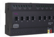
8 каналов 16А/канал Реле