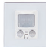
Ультразвуковой датчик на стену